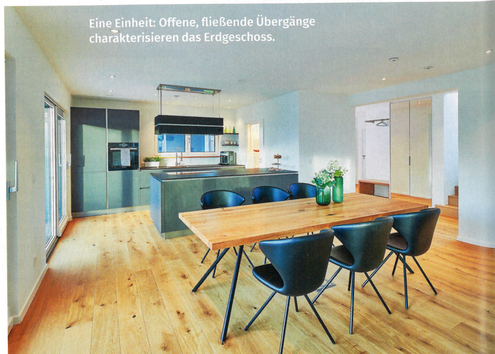
Eine Einheit: Offene, fließende Übergänge charakterisieren das Erdgeschoss.

Aber auch innen wird man nicht enttäuscht. Sogar der Eingangsbereich ist groß und offen gestaltet, sodass sich selbst mehrere Besucher gleichzeitig darin aufhalten können. Die Garderobe ist großzügig geplant, was gerade in einem Familienhaus – wo alleine schon