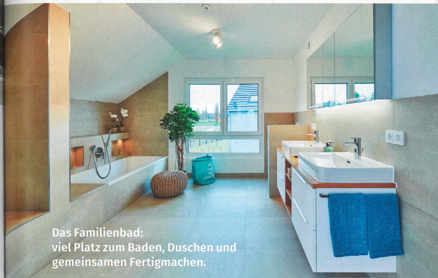
Das Familienbad: viel Platz zum Baden, Duschen und gemeinsamen Fertigmachen.

die Kinder mit Schneeanzügen, Jacken oder Regenmänteln viel Platz benötigen – enorm wichtig ist.